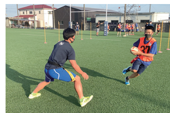
ラグビー競技体験