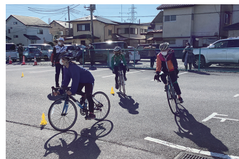
トライアスロン競技体験